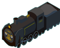
C61 20 シロクイチさん