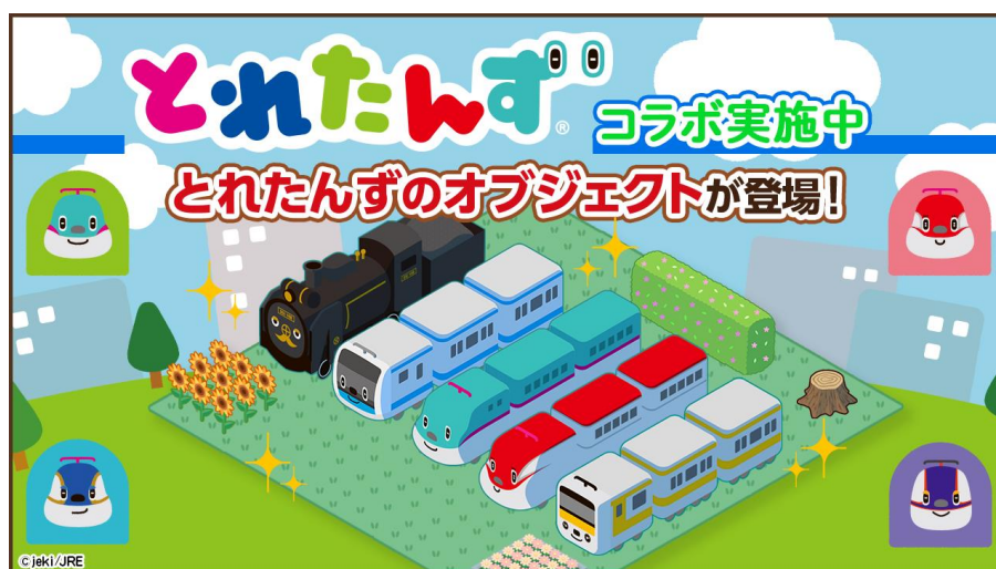
第1弾コラボ 特集ガチャ コラボキャラクター マイタウン設置イメージ図

株式会社クリーク・アンド・リバー社と株式会社ジェイアール東日本企画が共同配信中のスマートフォン向け位置情報+街づくりゲームアプリ『とれたんず』(JR東日本商品化許諾済)は、5月27日(木)より、『とれたんず』とのコラボイベントをスタート。本コラボでは、特集ガチャ、ミッションイベント、すごろくイベント、ランキングイベントの開催と共にコラボイベントとしては初のプロフィールアイコンも登場いたします。