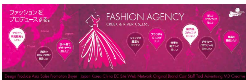
当社のブース全面に設置されるデザインパネル

昨年12月にはファッション業界に特化した人財サービス及び店舗運営会社、株式会社インター・ベルがグループ加わり、ファッション業界のプロフェッショナルのネットワークは2,000名以上、クライアント企業数は250社を超えました。ネットワークは、デザイナー、パタンナー、マーチャダイザー（MD）などのクリエイターやファッションアドバイザー（販売員）など多岐に亘り、日本国内での研修や海外でのヴィジュアルマーチャダイジング（VMD）研修の実施なども、大きな成果を上げております。