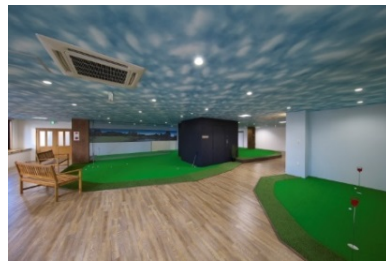
「GOLF LiViNG KOGA」