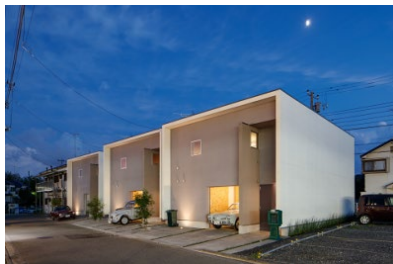
「STAPLE HOUSE® KOGASAKA」

C&R社建築事業部が展開する「安定稼働と長期入居」の観点から、住む人のライフスタイルを潜在的に創出する賃貸住宅づくりのシリーズ。現在下記の3シリーズを含め、15シリーズを展開中。