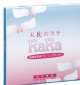
写真は「天使のララ 10ml×10袋」。 各公演の会場販売で購入者特典あり!!