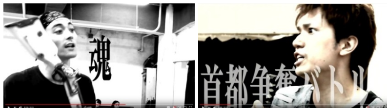
山陰対決(鳥取さんVS島根さん)の稽古シーンを動画で特別公開 両県の魂が込められた熱いラップバトルを見逃すな!!