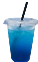
その名も「スタベのブルー-KISS」! *写真はイメージです