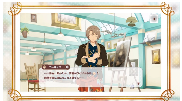
脱衣と苦悩の芸術家：ゴギャン（CV：斉藤壮馬）