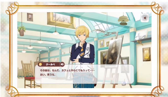
妄想キライなリアリスト：クールベ（CV：逢坂良太）