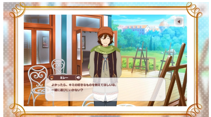
すぐ騙されるファーマー苦勞人：ミレー（CV：赤羽根健治）