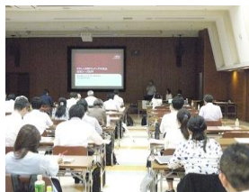
2018年9月、川崎での知財マッチング交流会(川崎信用金庫ホールにて)