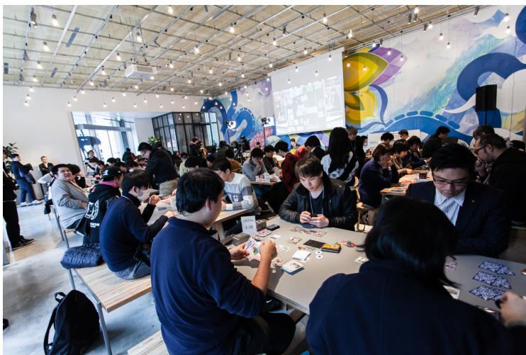
新虎通りCORE 1F 「THE CORE KITCHEN/SPACE」会場