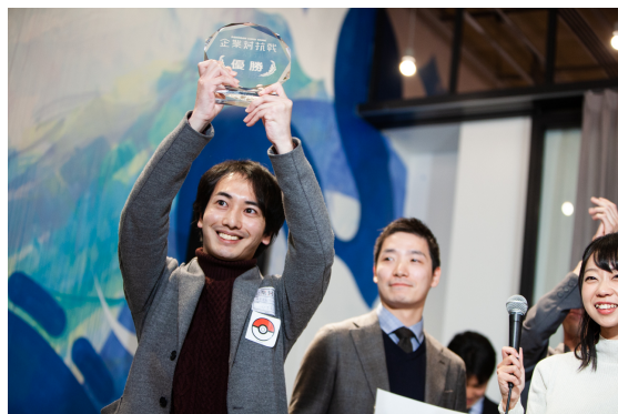
優勝:株式会社リップルコミュニティ