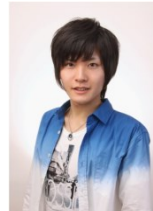
「ね子」CV:永塚拓馬さん

■アニメ番組『ね子とま太』 毎週木曜深夜25:25~フジテレビ『#ミレニアガール』内にて放送中。1話42秒で構成。ゆるさと切なさが盛り込まれたアニメーション作品です。*放送時間は予告なく変更の場合あり。