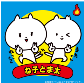
ね子とま太オリジナルステッカー *画像はイメージです