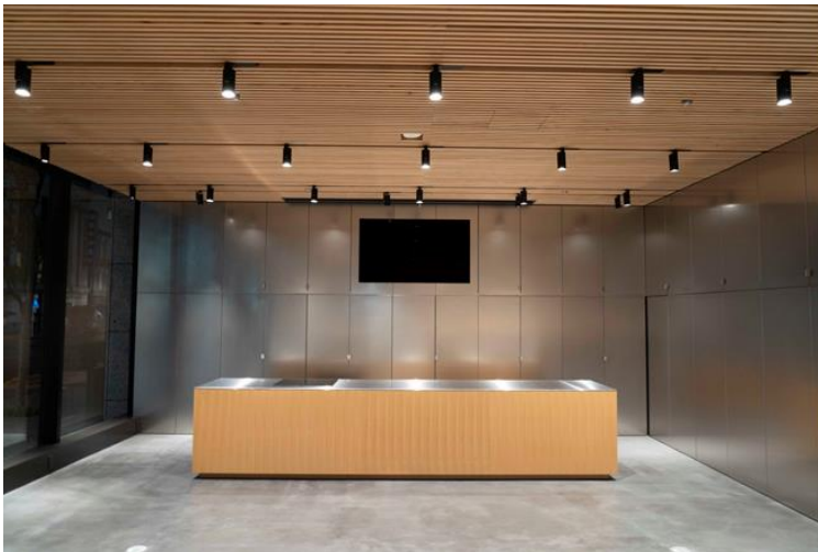
KRD Nihombashi Studio