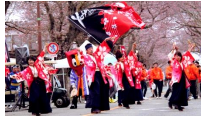
チーム富岡 さくらYOSAKOI