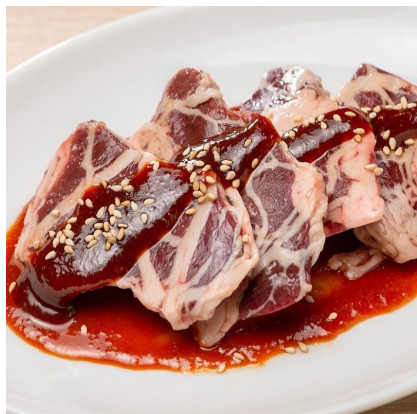
ときわ亭本家あみ巻きレバー 690円 牛脂の網で豚レバーを巻いた、リピーター続出の人気商品。