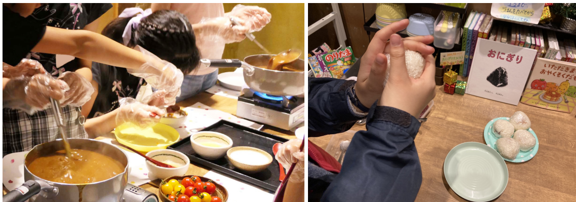
こども達が料理をしている様子

～こどもたちは、たくましく、すくすく、のびのびと～をスローガンに、食べる、遊ぶ、学ぶ、体験する、実践する様々なプログラムがあります。定期イベントでは、こどもたちと一緒に料理を作り、お客様に疑似通貨を使って販売し、その疑似通貨で景品（ノート、ペンなど）に交換できるという面白い体験も行っています。