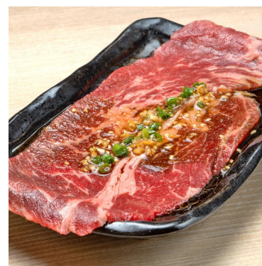
シン・ときわ亭ロース 979円 皿からはみ出ると迫力の大判ロース！キメ細かい肉質で旨味があふれます。