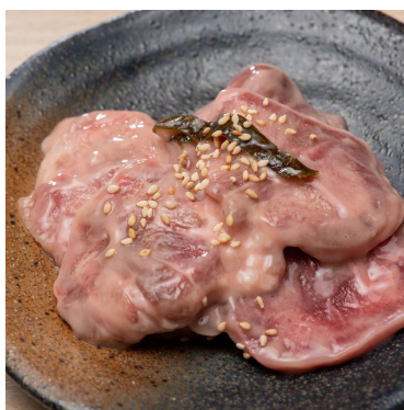
ときわ亭本家昆布×豚たん 638円 豚たんを昆布と酒粕で漬け込みました。レモンサワーと相性バッチリです。