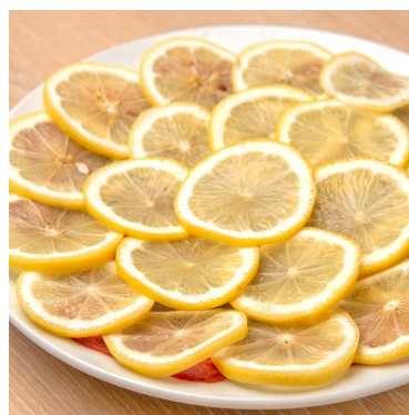
レモン牛たんカーペット 1,639円 薄切りの牛たんにスライスレモンを敷き詰め、お肉に香りを移すことで、牛たんの旨みと爽やかなレモンの風味が同時に楽しめます。