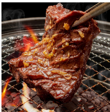
座布団ハラミトリュフソース付き 1,089円 旨味がたっぷり詰まった肉厚ジューシーなハラミに食らいつけ！