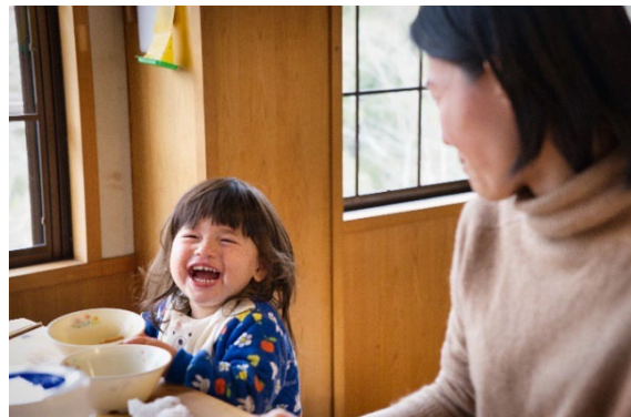
食事を囲む月ヶ瀬住民