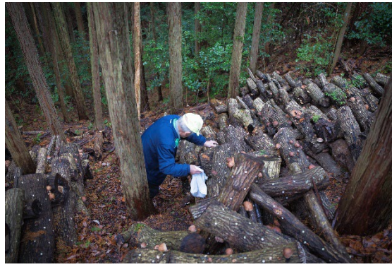
急峻な山の斜面に組まれたホダ木から椎茸を収穫