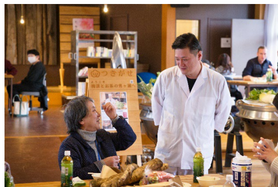
交流会にて生産者と歓談