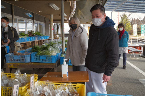
ふれあい市場を視察