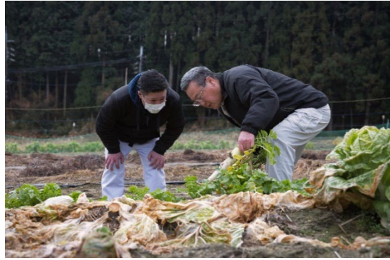
抜きたての大根を囲んで土壌や生産方法についてお伺いする