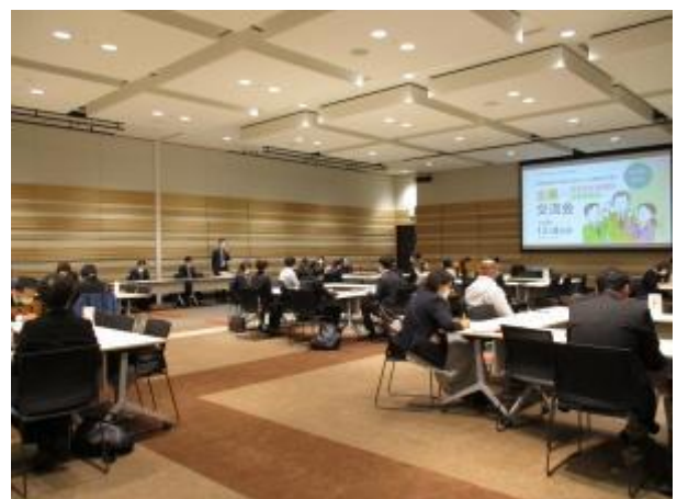
▲企業×障害者支援機関・支援事業所交流会