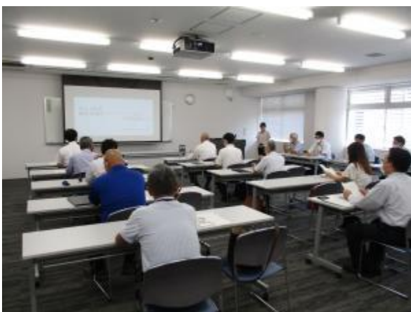
▲障害者雇用スタートアップセミナー