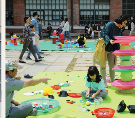
韓国国立現代美術館ソウル館でのワークショップの様子

はがき、FAXに「ならのはこぶね申込」、希望者数、住所、氏名、年齢、電話番号を明記し、12月10日(月)までに裏面記載の事務局宛先へ。公式ウェブサイト内申し込みフォームからも申込可能。後日入場はがきを郵送します。残席に余裕があれば当日券を会場にて発行します。