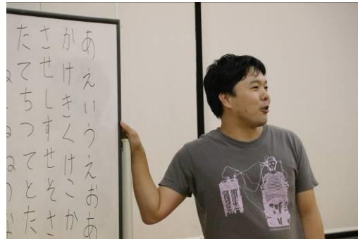
講師には奈良で活動する演劇人も参加