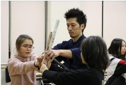
プロの殺陣師の指導による体験プログラム