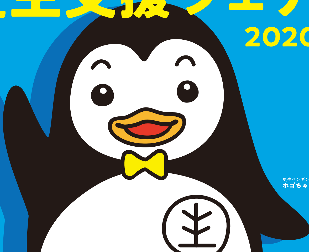
更生ペンギンの ホゴちゃん