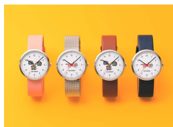
3) LISA LARSON®