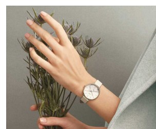
4) xme Paris