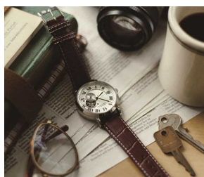
2) Movement in Motion