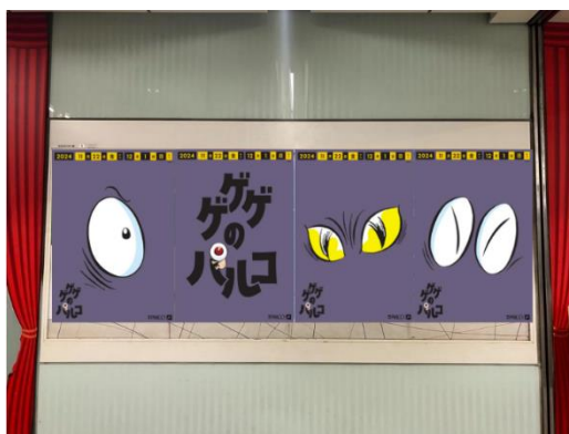
調布駅（設置イメージ）