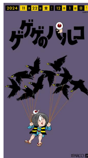
館内サイネージ（設置イメージ）