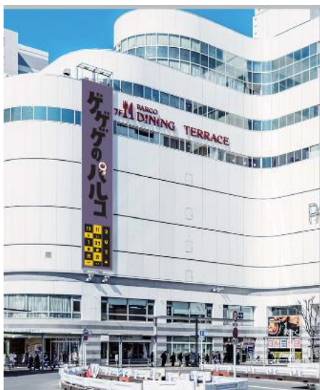
懸垂幕（設置イメージ）

調布 PARCO 外壁の懸垂幕ほか、調布駅構内、館内サイネージなど、いろいろなところに妖怪たちが出現！館内サイネージは全 6 種あるので、全種類のキャラクターを見つけてみてください！