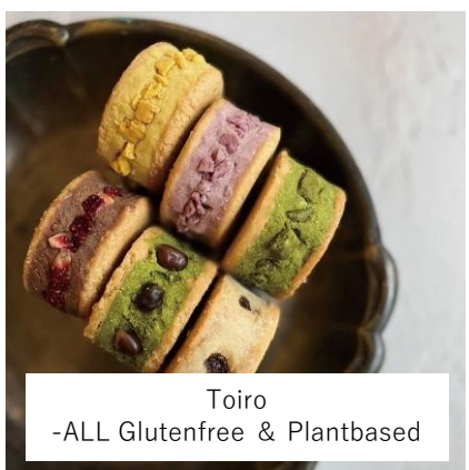
Toiro -ALL Glutenfree & Plantbased