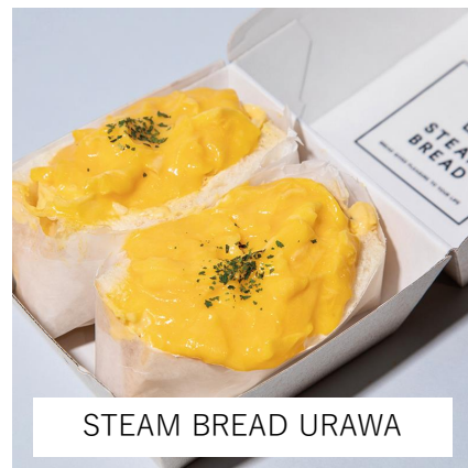
STEAM BREAD URAWA