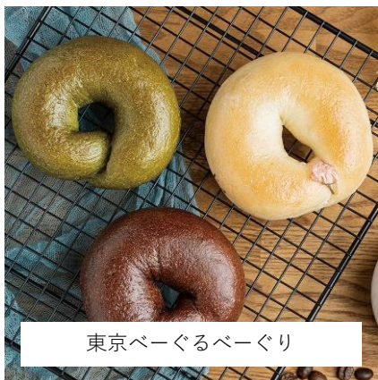
東京ベーグルぐるぐる