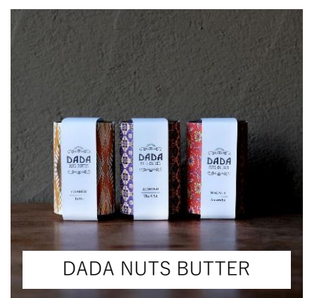
DADA NUTS BUTTER