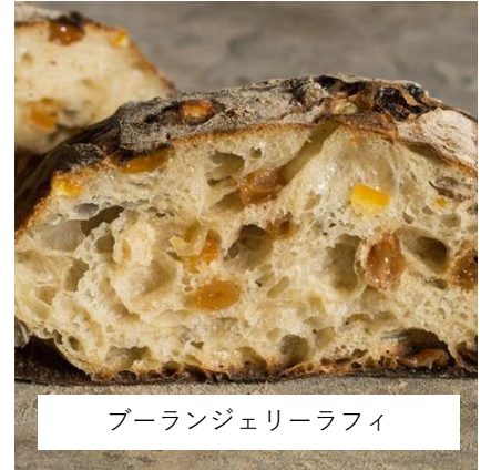
ブルーランジェリーラフィ