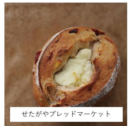
せたがやブレッドマーケット