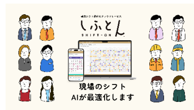
◀ AIで簡単 シフト作成