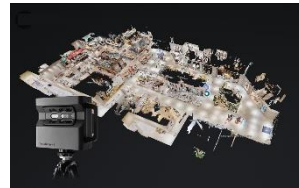
◀ Matterport 活用事例