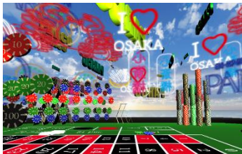
◀ XRによる 顧客体験向上

パルコデジタルマーケティングは、商業施設や専門店のパートナーとして、顧客とのコミュニケーション強化や業務改善のソリューションを提供しています。今回は、リテールメディア（XR / AIカメラ・サイネージ）による顧客体験の向上や、AI活用による業務効率化（シフト管理 / Webサイト更新）、エコテックによるサステナブル推進（企業間グループウェア）のソリューションをご紹介します。