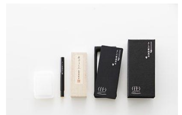
陶硯×刀剣 硯セット（紙箱バージョン）13,730円（税込）