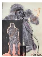
約32年間パルコの倉庫に眠っていた作品