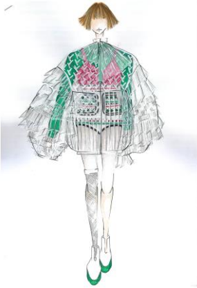
田中佑芽 (たなか ゆめ) / アンファッションカレッジ