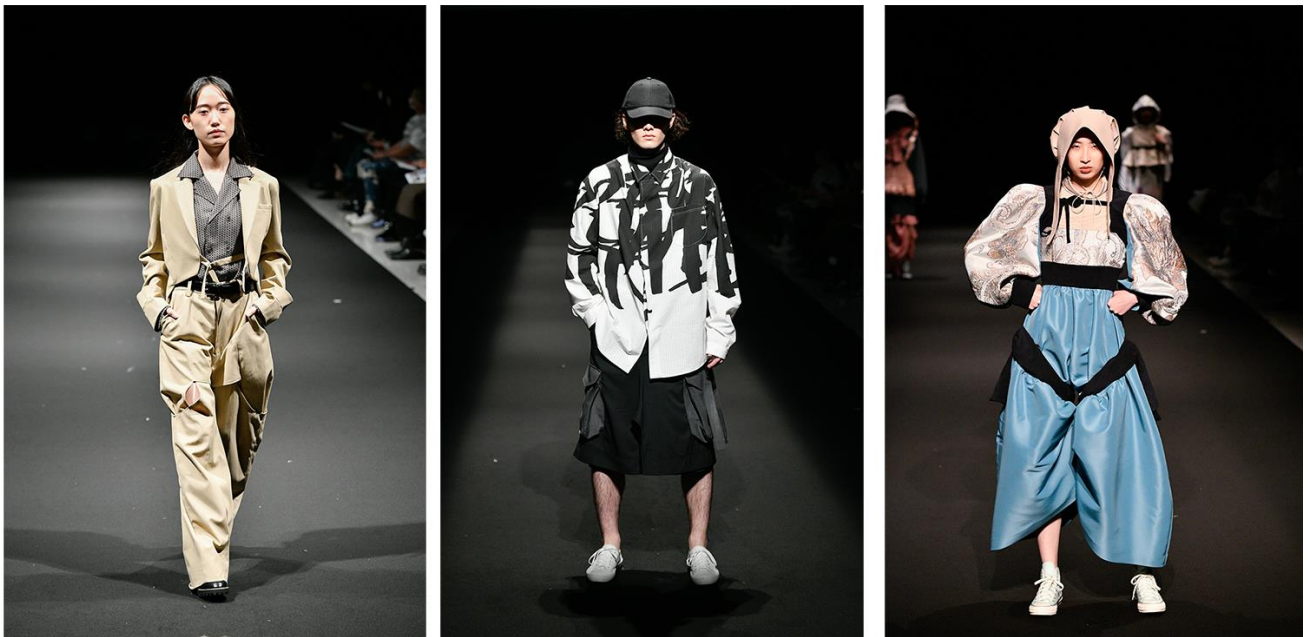
(左から)『YONLOKSAN (ヨンロクサン)』、 『BASICAL DIAMENTS COLOUR (ベーシカルダイヤモンドカラー)』、『kaoism(e) (カオイズム)』