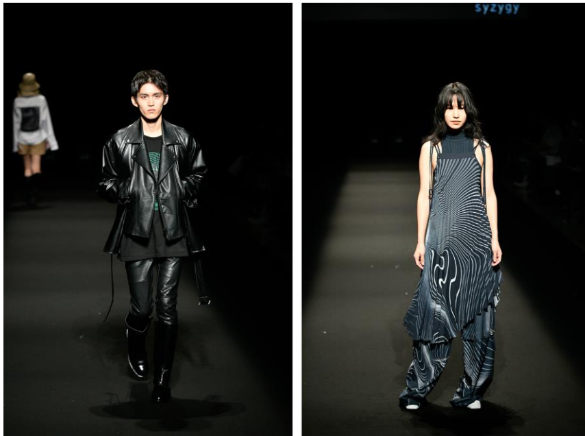
(左から) 韓国代表『continued_studio (コンティニュード スタジオ)』、台湾代表『Syzygy (スイズィジィ)』