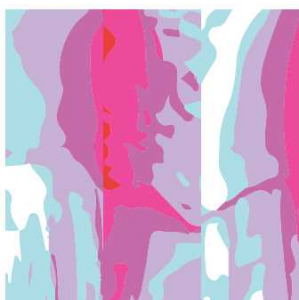
Rhizomatiks inspired by Perfume 2020