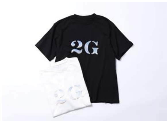
ロゴTee S/S (2G TOKYO) ¥7,000