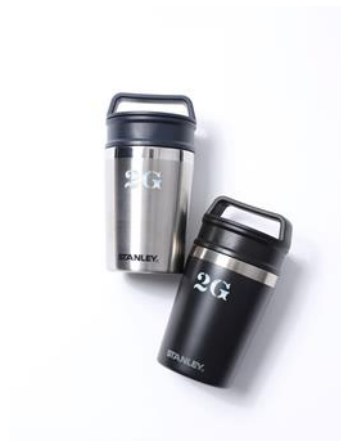
タンブラー (2G TOKYO × STANLEY) ¥3,500