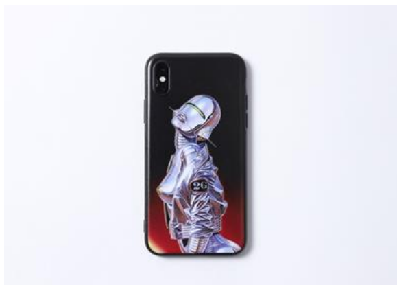
iPhoneケース (2G TOKYO) ¥3,500