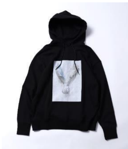
Hoodie (2G TOKYO) ¥23,000