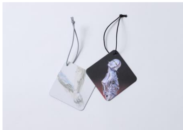
カータグ (2G TOKYO × retaW) ¥1,800