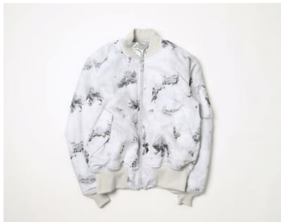
MA-1 (2G TOKYO × ALPHA INDUSTRIES) ¥75,000