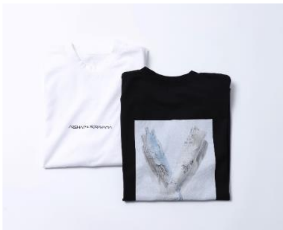
グラフィックTee S/S (2G TOKYO) ¥10,000 グラフィックTee L/S (2G TOKYO) ¥13,000