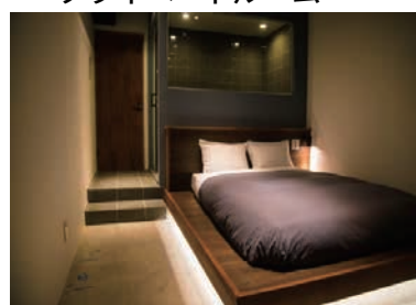
プライベートルーム