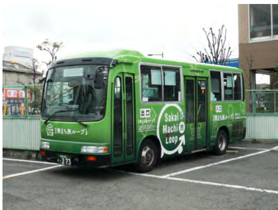
▶ 周遊バス「堺まち旅ループ」(※土・日・祝休日運行車両)

さらに宿泊プランには、南海本線で利用可能な回数券もつき、ホテル最寄駅 南海本線「難波駅」から堺巡りの拠点地「堺駅」までよりスムーズにアクセスして頂けます。大阪ミナミの中心で大阪らしい賑わいを楽しみ、さらに隣接する街「堺」の新しい魅力と豊かな歴史や文化を満喫できる旅をお届けします。