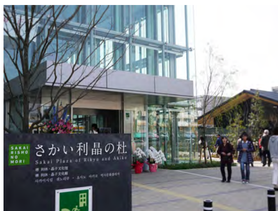
▶ 今年春オープンした「さかい利晶の杜」