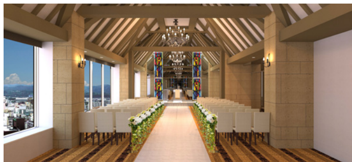
電動カーテン開放時