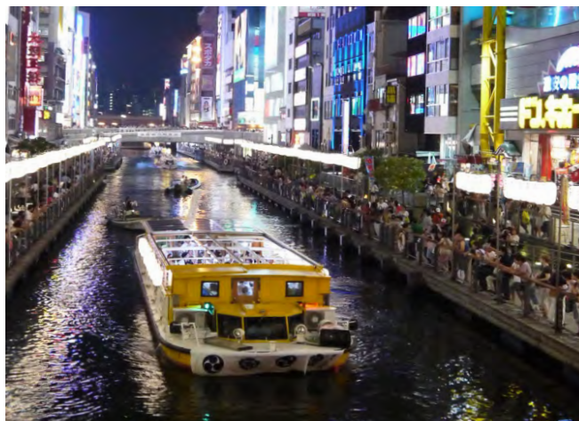
▶ 道頓堀川沿いは約1300灯の提灯が点り煌びやか。