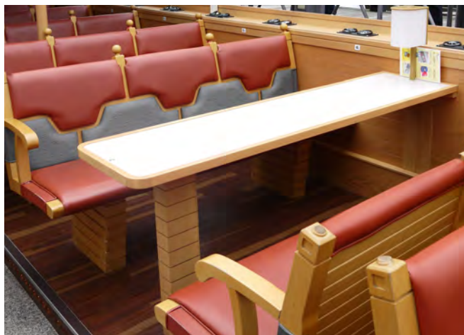
▶ 屋根付きの観光船でゆったりとお楽しみ頂けます。