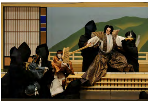
▲一谷嫩軍記(いちのたにふたばぐんき)