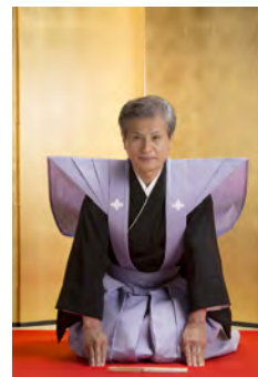
▲二代目 吉田玉男 襲名披露