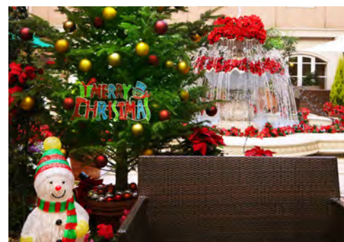
▲ 噴水を背景に記念撮影ができるフォトスポット