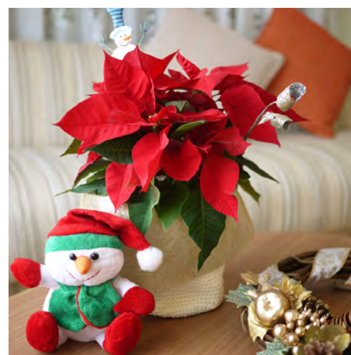
▲ ポインセチアはお持ち帰り頂けます