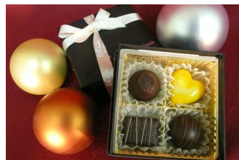
▲ チョコレート専門店「エクチュア」のチョコレート