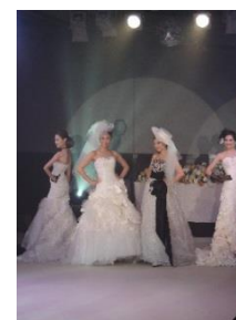
ドレスファッションショーイメージ

「ファーストダンスが躍れるほど軽いドレス」をメインコンセプトとして、花嫁自身が挙式当日を心から楽しめるように着心地を重視。軽くて上質なドレスを厳選して取り揃えています。フェア当日は、ガールズコレクションのトップモデル達がウエディングドレスを身にまとい、華麗なショーを展開します。