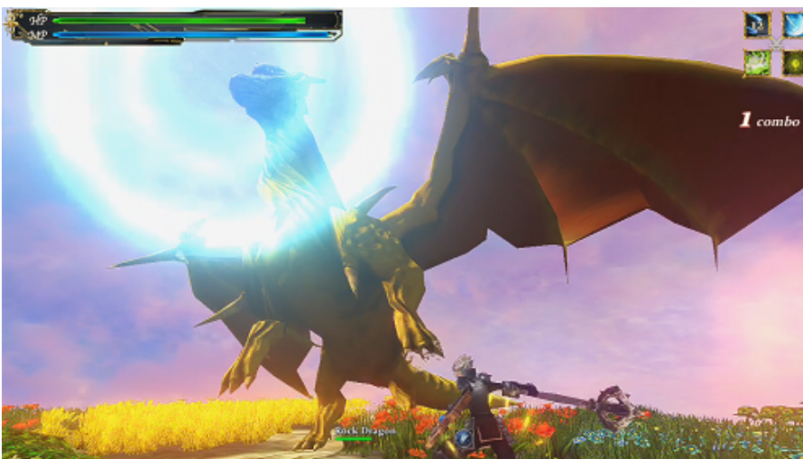
ロックドラゴン撃破！