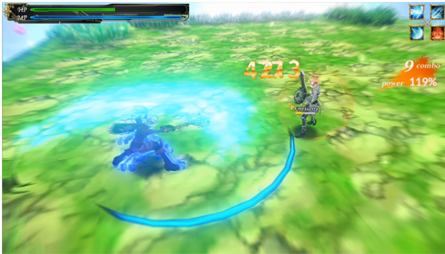
チュートリアル クリサリス戦