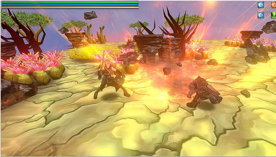
騎士団長ザインの撃破