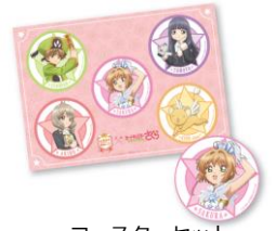
コースターセット