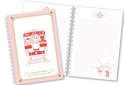
ラリーコンプリート賞 オリジナルグッズ