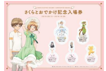
さくらとおでかけ記念入場券