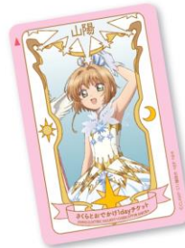
さくらとおでかけ1dayチケット

山陽電車全線(西代～山陽姫路・山陽網干)が1日乗り降り自由、さらに須磨浦ロープウェイ・カーレーターも往復乗車可能な1dayチケットを発売いたします。通常料金2,820円のところ、1,200円でご利用いただけるほか、「カードキャプターさくら」のデザインをお楽しみいただけます。