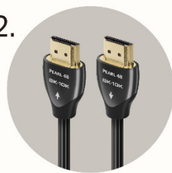
HDMI ケーブル Pearl 48 / 3m