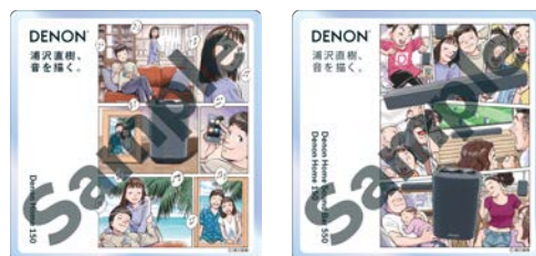
9cm×9cm アクリル製 コースターセット（2枚1組）

*対象製品の「領収書またはレシート」と「保証書」を購入製品の「型名」、「製造 No.」、「購入日付」が分かるように並べて1枚の写真になるように撮影してください。