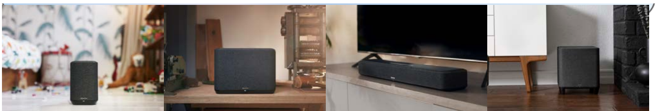
Denon Home 150

https://www.denon.jp/ja-jp/urasawa/index.html