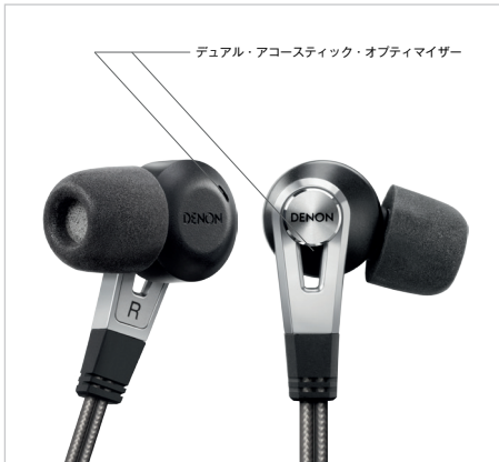
デュアル・アコースティック・オプティマイザー

ハウジングには質感の高いアルミダイキャストとABS樹脂を用いたハイブリッド構造を採用。不要な振動を抑え、透明感の高いサウンドを実現します。