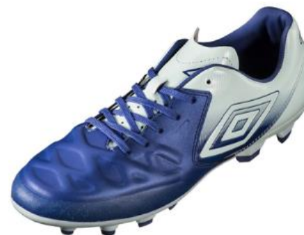
「ACR シーティアー KTS HG」

品名：「ACR シーティアー KTS JR HG」（ジュニア） 品番：UU4NJA01 価格：¥8,500+税 サイズ：21.5-24.0（0.5 cm刻み）