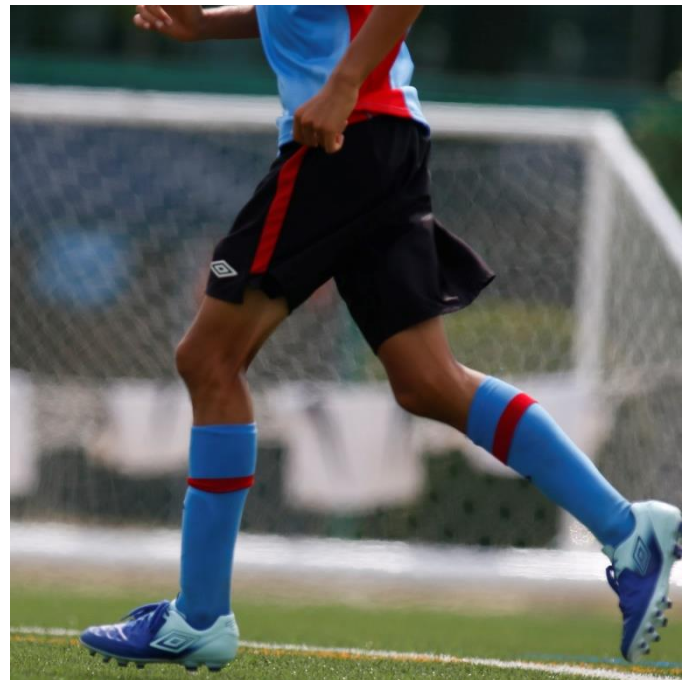
「GAINA」搭載アイテムを着用している様子