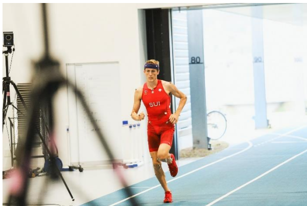
被検者として実験に参加しているアトラン選手