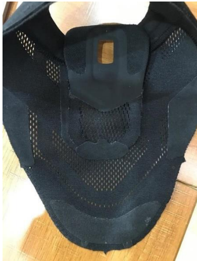
アッパー内側を広げた様子