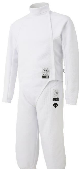
『デサント』ブランド フェンシング競技ウェア

今後も、さらなる改良のためフェンシングの動作解析・検証を行い、選手が最高のパフォーマンスを発揮できるようサポートするとともに、「モノを創る力」の強化に努めてまいります。