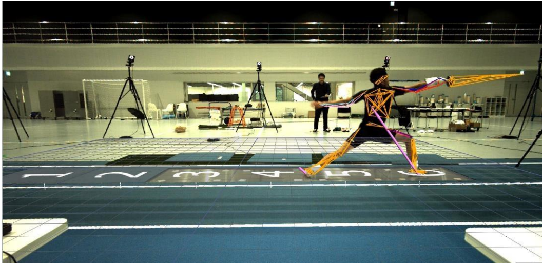
「DISC OSAKA」で行ったフェンシングの基本動作解析の様子