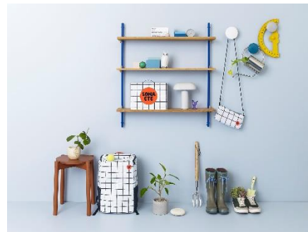
▲おいしく食べる長期保存食『イザメシ』と日常の風景に溶け込むデザイン防災袋&セット『ソナエテ』