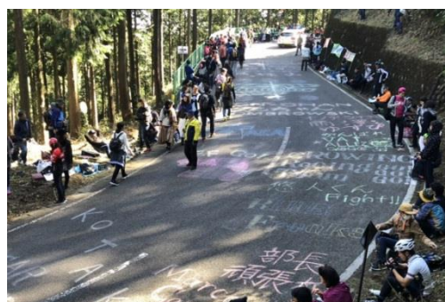
ロードレース当日。路面には観客から選手への応援メッセージ。