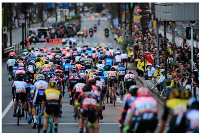
沿道には大勢の市民が応援に訪れた。来場者数は史上2番目の多さとなった。

本大会は、ワンデイ・レースとしてはアジアで唯一最上位カテゴリーの「オークラス」に位置づけられるレースで、世界で活躍する選手たちを日本で見ることが出来る唯一の大会です。27回目となる本大会は、昨年の14チーム69名から大幅増の21チーム122名が出場し、例年に増して熱いレース展開となり、一昨年の大会で3位に入賞したロブ・パワー選手（オーストラリア出身、ミッチェルトン・スコット所属）が優勝しました。また、前日に開催されたクリテリウムでは22チーム129名が出場し、世界屈指のスプリンターであるジョン・デゲンコルプ選手（ドイツ出身、トレック・セガフレード所属）が優勝を飾りました。