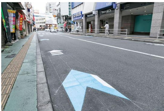
自転車専用通行帯の整備距離の長さが全国1位

ジャパンカップの開催地である宇都宮は、餃子が全国的に有名ですが、実は自転車でも有名な街です。1992年よりジャパンカップを開催したことをきっかけに、いまや自転車は宇都宮市民にとって最も身近で愛着ある乗り物として広く親しまれています。日本初の地域密着型のプロロードレースチーム「宇都宮ブリツェン」のホームタウンであるとともに、漫画「弱虫ペダル」でインターハイの舞台として描かれ、週末には他地域から自転車を乗りに来る聖地になっていることや、全国でも珍しいロードバイクのレンタサイクルがある「宮サイクルステーション」、自転車で立ち寄ることを前提としたバイクスタンド付きのカフェやコンビニがあるなど、スポーツとしての自転車が浸透しているほか、坂が少ない地形で、自転車専用通行帯の整備距離の長さが全国1位であるなど、市民にとって自転車は日常生活の一部であり、街を少し歩けば、自転車で通学する学生や社会人を多く見かけることができます。