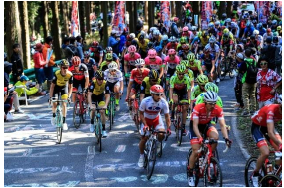
(C) Makoto AYANO/2018JAPAN CUP CYCLE ROAD RACE