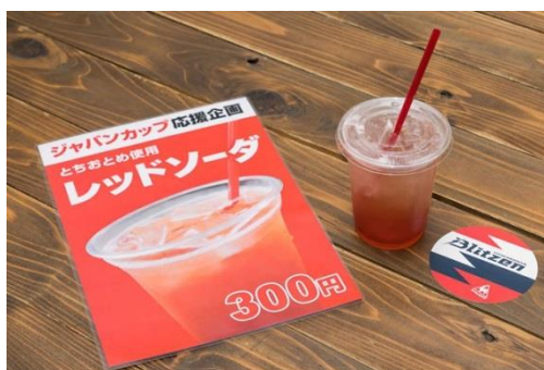
レッドソーダ：アンテナショップ「宮カフェ」で販売された限定商品。