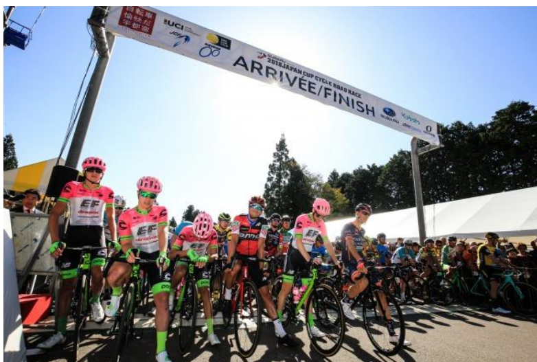
(C) Makoto AYANO/2018JAPAN CUP CYCLE ROAD RACE

宇都宮市をはじめ、地域の経済・まちづくり団体や市民等で構成する宇都宮ブランド推進協議会は、2018年10月19日（金）～21日（日）の三日間で約13万7千人が集まり大盛況に終わった、アジア最高峰の自転車ワンデイロードレース「2018 JAPAN CUP CYCLE ROAD RACE in UTSUNOMIYA」の様子と、訪れた選手から見た宇都宮の魅力を本レポートにてお伝えいたします。