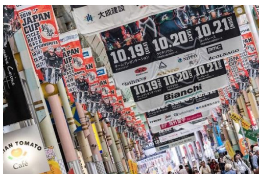
「ジャパンカップ」のポスターを掲示するオリオン通りの様子