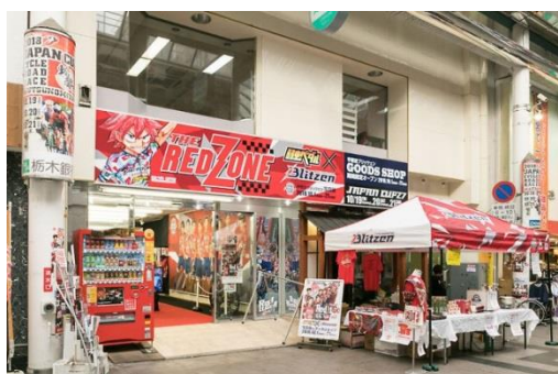
ブリッツェンのオフィシャルストア「THE RED ZONE 2018」