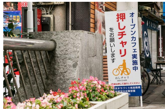
オリオン通り内の看板：自転車での人通りが多いためか、自転車を押して歩く「押しチャリ」を推奨している。