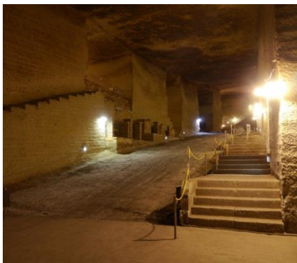
大谷資料館内の様子

大谷石（おおやいし）は軽石凝灰岩で、栃木県宇都宮市北西部の大谷町付近一帯で採掘される石材のことです。柔らかく加工がしやすいことから、古くから外壁や土蔵などの建材として使用されてきました。宇都宮は大谷石の文化が根付いており、街のいたるところで大谷石が使われた建築物があります。近代建築三大巨匠の一人であるフランク・ロイド・ライトが設計した旧帝国ホテルに使われていたことでも有名です。また、大谷資料館という大谷石を掘り出してできた巨大な地下空間を展示する施設があります。坑内の年平均気温は 8℃前後。かつて政府米の貯蔵庫として利用され、現在ではコンサートや美術展、演劇場、地下の教会として、また写真や映画のスタジオとしても注目を集めています。