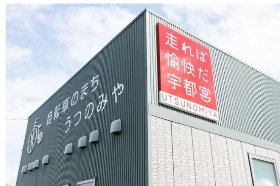
宮サイクルステーション：レンタサイクルができる施設。「走れば愉快だ」のロゴが印象的。