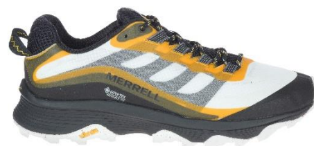
メンズ-ハイライズ