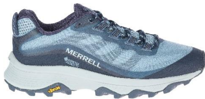
ウィメンズ-アルティテュード