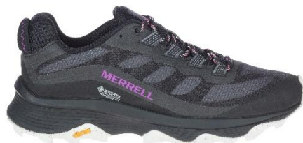
ウィメンズ-ブラック