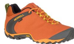
カメレオン 8 ストーム