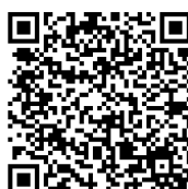
【AR QR コード】

AR URL: https://www.instagram.com/ar/3432053733554383/