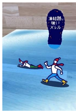
【AR フィルターイメージ】