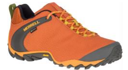
カメレオン 8 ストーム