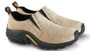
ジャングルモック

MERRELL YouTube チャンネル : https://www.youtube.com/channel/UC13E10yckCdRU8vCAhe1I-Q