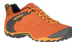
カメレオン 8 ストーム