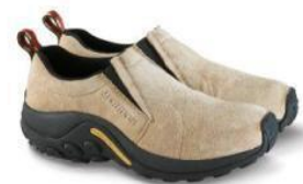
ジャングル モック

MERRELL YouTube チャンネル : https://www.youtube.com/channel/UC13E10yckCdRU8vCAhe1I-Q