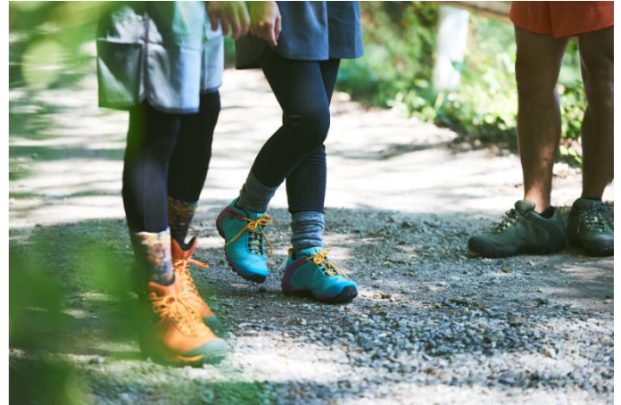
CHAMELEON 8 STORM MID GORE-TEX®

世界 160 カ国で愛用される米国アウトドアブランド MERRELL（メレル、輸入総代理店：株式会社丸紅フットウェア）は、王道ハイキングシューズとして人気のカメレオンシリーズから、4 シーズンぶりのアップデートモデル「CHAMELEON 8 STORM MID GORE-TEX（カメレオン 8 ストーム ミッド ゴアテックス）」を発売します。