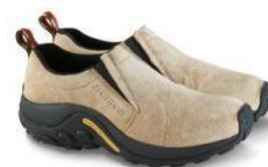
ジャングル モック

SS20 コレクションでは、「ONE SHOE. MANY ADVENTURES. ～ #どこだって冒険になる」をテーマに掲げ、キャンプからデイリーユースまで多様なアウトドアライフスタイルにマッチするシューズを提案します。