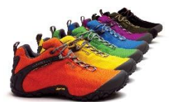
カメレオン 2 ストーム 日本限定色第二弾（2009）

「CHAMELEON STORM」は 2006 年のデビュー以来、機能性とファッション性を兼ね備えたアイテムとして、本格的なトレッキングのみならず、フェスでも多くの方に親しまれているハイキングシューズです。あらゆる環境に対応するその汎用性にちなみ、動物カメレオンの名が付けられています。このモデルが更に人気となったのは、日本限定色を発売したことがきっかけです。当時のアウトドアシューズには珍しいユニークなカラーパターンとアイコン的なデザインによりアウトドアフィールドで評価を得ていたモデルが、ストリートシーンやフェスシーンでも人気を博しました。